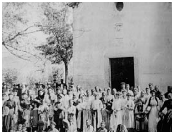
Celebració d'una festa a sant Gaietà, a la Ginebreda el 7 de setembre de 1904, que correspondria a una entrega de pans per part dels pobres.

El que havia estat un ús reservat als privilegiats es popularitza. Amb la neu es feien, a més de gelats i pastissos, diverses begudes fresques com l'orxata o la llimonada, però s'estenia ràpidament el gust pel vi fred i per l'anomenada "aigua de neu", que es feia amb llimona i mel, però també l'aigua d'anís, l'aigua de canyella i d'altres espècies. Algunes d'aquelles aigües es venien de forma ambulat, a tasses o a copes, fins al segle XIX, tal com ho recull el costumari català.