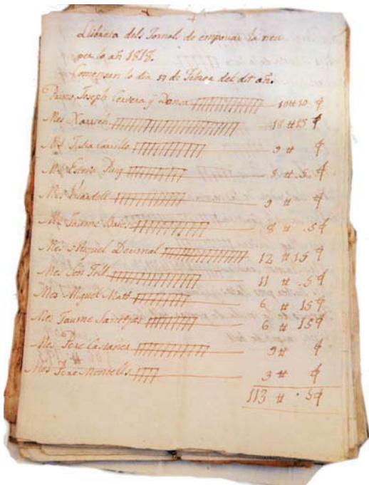
Libreta dels jornals d'empouar la neu. Arxiu de Can Cervera. 1818. Montseny.