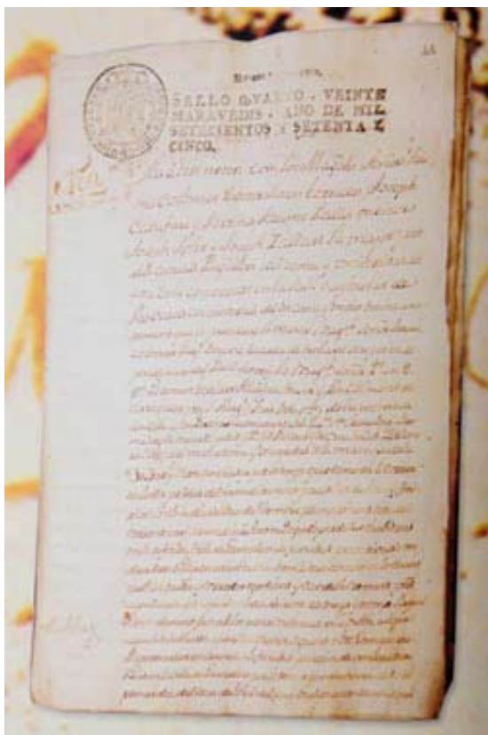
Arrendament de la neu de la vila de Granollers. Manual del Comú, 1775, fol. 34.

Una prova més de la importància econòmica d'aquella activitat al Vallès va ser, sens dubte, la significativa presència entre els arrendataris del proveïment a la ciutat de Barcelona, especialment de