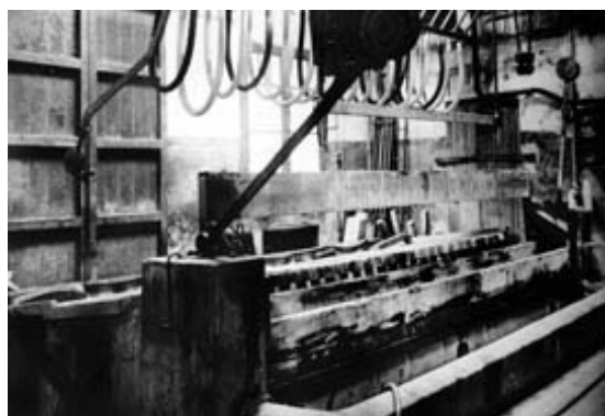
Interior de l'antiga fàbrica de gel Solà al carrer de Barcelona, a Granollers. 1992

Aquell avenç tècnic deixaria l'antiga producció preindustrial per al consum dels pobles de muntanya i de les zones més properes. Les últimes dades dels pous del Montseny són de 1862; a l'àrea de Castellterçol l'últim que es va utilitzar fou el pou de cal Carabrut, de Sant Quirze Safaja, entorn de 1920, i els més tardans van ser els de l'Avencó, que van fer la darrera empouada el 1931. Durant algun temps, però, van coexistir el gel natural i l'artificial; en aquest sentit és bo de recordar que l'empresa barcelonina de gel artificial Folch, Albinyana i Companyia va adquirir els drets de bona part dels pous del Moianès per tal d'assegurar-se que si els consumidors es resis-