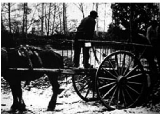
Procés d'elaboració dels pans de glaç a la bassa de l'Avencó i transport amb el carro fins al pou. Dècada de 1940. Arxiu familiar Dachs. Molí de Blancafort. La Garriga.

La producció de glaç es feia a les basses construïdes prop dels pous o amb l'aigua que s'embassava al costat mateix de torrents i de rieres. Un cop aconseguit un gruix de glaç entre 20 i 30 centímetres es trencava amb masses o magalls, o bé es serrava a l'entorn d'uns motlles i així s'aconseguien blocs regulars, com els de l'Avencó, que eren de 120 x 70 cm. Per empouar es carregaven en carros, a bast o simplement s'estiraven amb ganxos fins a dipositar-los al pou, on també els empouadors separaven les capes amb bolls per impedir que es compactessin. Els espais que quedaven buits es reomplien amb els trossos de glaç que s'havien després i finalment es colgaven com en el cas de la neu.