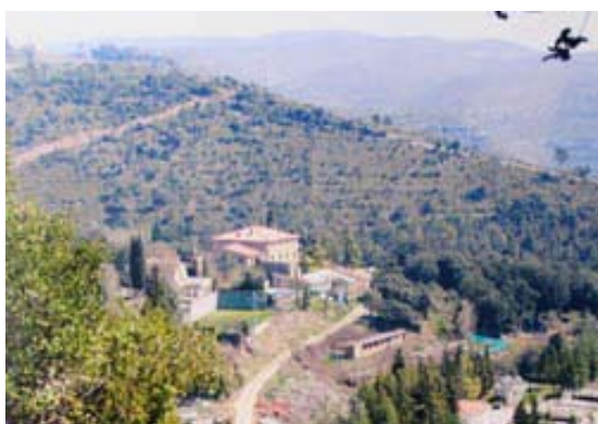
Masia de les Torres de Sant Quirze Safaja.