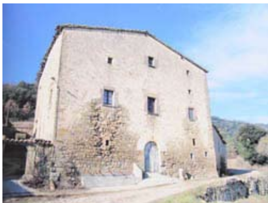
Masia de la Ginebreda. Castellterçol.

ta de fondo, cubert amb volta grassa, paredat tot a l'entorn a pedra y calcs y possat a punt per emp[ou]jar glas...". En alguns casos la coberta era feta amb un embigat de fusta i teules.