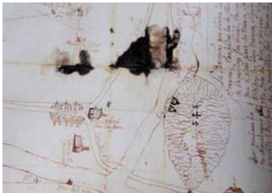
Pous i basses de glaç en el plànol del terme de Montmeló de 1747 fet per Matheu Puig. Arxiu del monestir de Sant Pere de les Puel·les. Barcelona.

Les rutes del glaç estaven en relació amb les zones de producció i amb l'estat dels camins. Des de Castellterçol, Castellcir i Sant Quirze es dirigien a Sant Feliu de Codines, Caldes de Montbui i Palau-solità fins a Montcada, on podien canviar el transport a bast i seguir amb carro. Des de l'Avencó i Granollers, amb la resta del pla, seguirien pel camí ral de Vic a Barcelona. Els del Montseny seguirien tres rutes distintes: de Palautordera a Vilamajor i Granollers; de Sant Celoni per Vallgorguina i cap a Mataró, i per Hostalric cap a les poblacions de la costa.